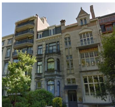
Vue depuis la rue.

En réponse à votre courrier du 19/12/2024, nous vous communiquons l'avis émis par la CRMS en sa séance du 15/01/2025, concernant la demande sous rubrique.