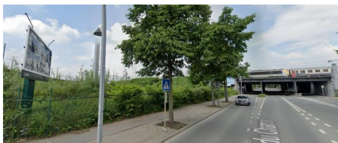
Vue du panneau publicitaire et du pont classé.