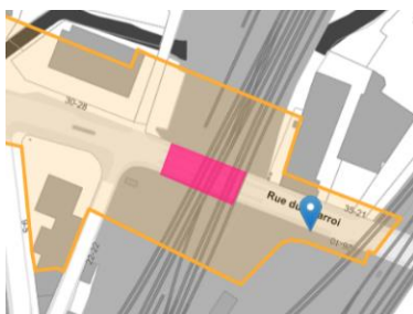
Situation patrimoniale @Brugis

En réponse à votre courrier du 08/01/2025, nous vous communiquons l'avis émis par la CRMS en sa séance du 15/01/2025, concernant la demande sous rubrique.