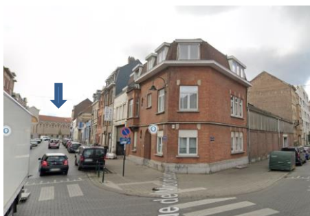
Zicht op het bestaande gebouw, met de voormalige Byrrh-vestiging (blauwe pijl)