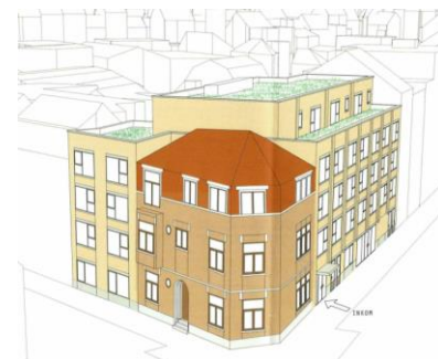
Axonometrie van de nieuwbouw, gevoegd bij de aanvraag

Het project zal weinig impact hebben op de voormalige, beschermde Byrrh-gebouwen. Het project dient in de eerste plaats aan een stedenbouwkundige analyse onderworpen te worden, met bijzondere aandacht voor de voorgestelde bestemming, de verdichting, de bouwdiepte en de profielen.