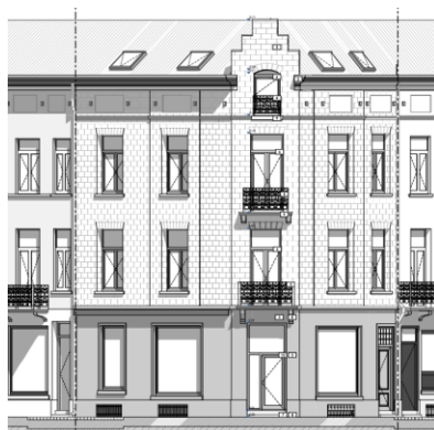
Façades à rue. Situation de fait. Image tirée du dossier.