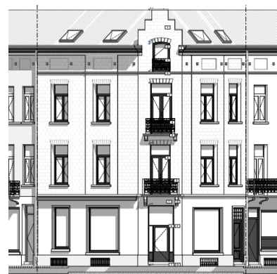
Façades à rue. Situation projetée. Image tirée du dossier.