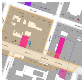
Localisation du bien

En réponse à votre courrier du 07/02/2025, nous vous communiquons l'avis émis par la CRMS en sa séance du 19/02/2025, concernant la demande sous rubrique.