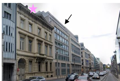
Localisation du bien