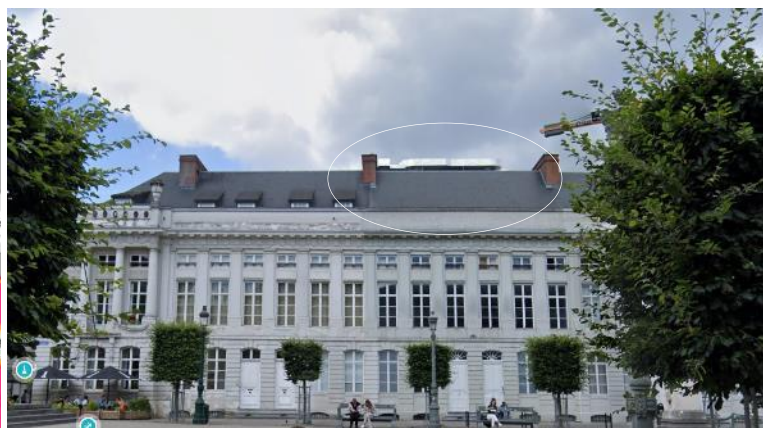
Localisation du projet et situation existante