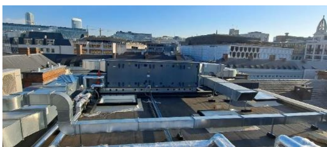
Installation existante, photo extraite de la demande

Suite au non-respect d'une telle configuration, le demandeur était invité à rendre l'installation totalement invisible depuis l'espace public pour se conformer au permis. À défaut, on lui demandait d'entamer la procédure pour régulariser l'installation infractionnelle en diminuant son impact visuel. Cette démarche fait l'objet de la demande actuelle, qui prévoit de conserver l'installation existante, en reculant le groupe technique vers la zone arrière de la toiture classée. Les conduits seraient partiellement intégrés au volume construit.