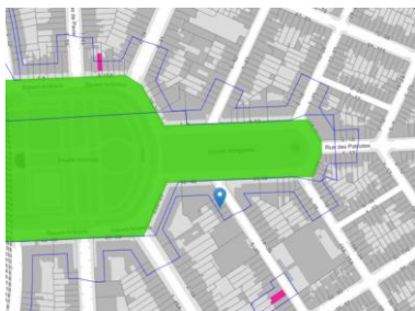
Localisation du bien

En réponse à votre courrier du 24/01/2025, nous vous communiquons l'avis émis par la CRMS en sa séance du 19/02/2025, concernant la demande sous rubrique.