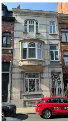
Façade sur rue (photo extraite de la demande)