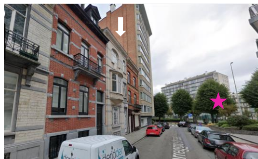
Localisation du bien

Les travaux visés par la demande de régularisation sont sans impact négatif sur les perspectives vers et depuis les squares classés comme ensemble et situés à proximité directe. Réalisés dans le respect des qualités architecturales de la façade sur rue, ils n'appellent pas de remarques d'ordre patrimonial.