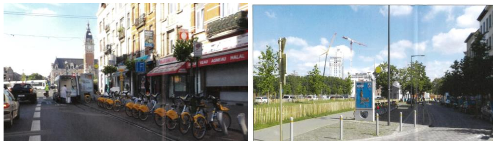
Ex. de stations Villo! avec panneaux publicitaires (bd E. Bockstael et bd de l'Abattoir) (extraits du dossier)

En réponse à votre courrier du 29/01/2025, nous vous communiquons l'avis défavorable émis par la CRMS en sa séance du 19/02/2025, concernant la demande sous rubrique.