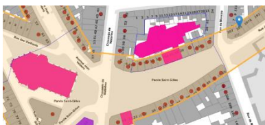
Localisation du bien

En réponse à votre courrier du 27/01/2025, nous vous communiquons l'avis émis par la CRMS en sa séance du 19/02/2025, concernant la demande sous rubrique.