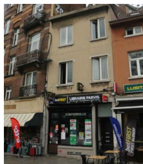
État existant de la façade à rue (photo extraite de la demande)