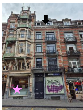
Localisation du bien

Les travaux concernés par la demande n'auront pas d'impact négatif sur les perspectives vers et depuis les biens classés situés à proximité, et n'appellent pas de remarques d'ordre patrimonial.