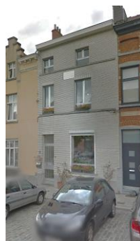
Situations existante et projetée de la façade, documents extraits de la demande