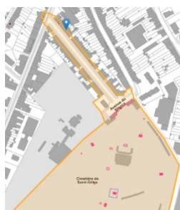
Localisation du bien

En réponse à votre courrier du 12/02/2025, nous vous communiquons l'avis émis par la CRMS en sa séance du 19/02/2025, concernant la demande sous rubrique.