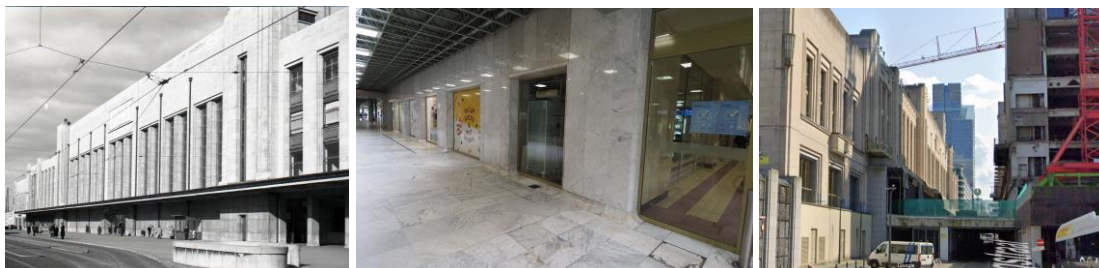
État ancien de la façade principale, façade du CCN 1974-2024 et travaux de démolition du CCN (photos extraites de la demande)

La demande concerne la façade principale, ouest de la gare Bruxelles-Nord. L'arrêté du 22/06/2023 entame la procédure d'inscription sur la liste de sauvegarde 1 , en raison de leur intérêt historique, artistique et esthétique des parties suivantes : la tour de l'horloge, les toitures et façades, à l'exception des zones en façade ouest aux niveaux 00 et +01 jusqu'à hauteur de l'auvent historique, la salle des pas perdus, les salles de l'ancien musée, ainsi que les quais et leurs aménagements . L'ensemble de la gare est depuis 2024 inscrit à l'Inventaire légal 2 .