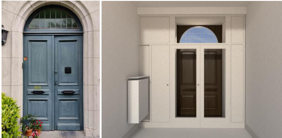
Bestaande toestand van de voordeur en ontwerptekening van de inkomzas, uit de aanvraag

Deze optie werd uitgewerkt op vraag van de DCE vanuit de motivatie deze vormgeving beter aansluit bij de oorspronkelijke landelijke typologie van het gebouw.