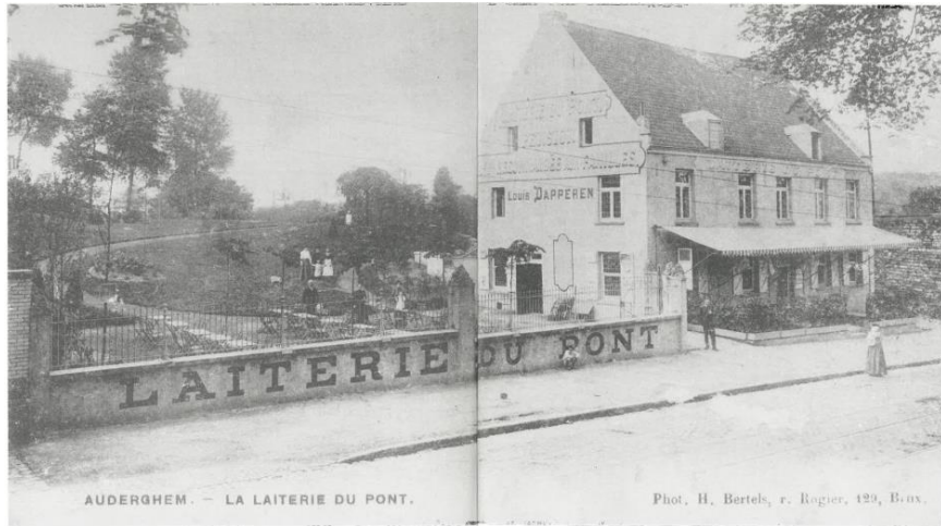
Foto van de boerderij uit het begin van de 20 ste -eeuw, toen het nog één gebouw was en dienst deed als La laiterie du Pont, langs de spoorlijn Brussel-Tervuren (Delcampe.net)