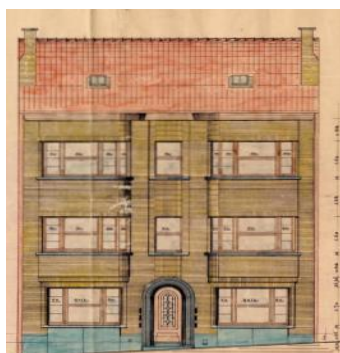
Façade à rue. Situation de droit

En réponse à votre courrier du 07/03/2025, nous vous communiquons l'avis émis par la CRMS en sa séance du 02/04/2025, concernant la demande sous rubrique.