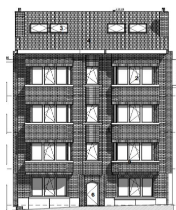
Façade à rue. Situation projetée