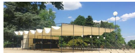
Vue de la guinguette installée. Montag3D. Image extraite du dossier.