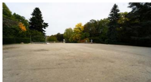
Vue de la localisation de la guinguette.

L'arrêté royal du 26 octobre 1973 classe comme site l'ensemble du parc Duden à Forest.