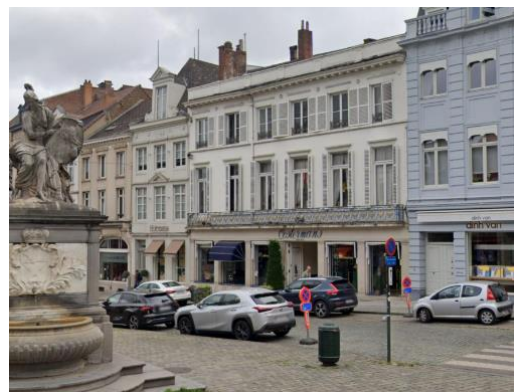
Vue de la façade sur la place du Grand Sablon.

L'ancien hôtel du Chastel de la Howarderie a été édifié vers 1785, et agrandi de deux travées en 1857 1 . La façade néoclassique se développe sur six travées et trois niveaux, de hauteur dégressive. Le rez-de-chaussée est transformé en 1954 par l'architecte L. Govaerts, qui y aménage un commerce. La nouvelle devanture est rythmée par des pilastres interrompus par de grandes baies rectangulaires, et couronnée par un balcon continu de style Louis XVI. Les vitrines sont à l'origine munies de châssis en acier de couleur bronze.