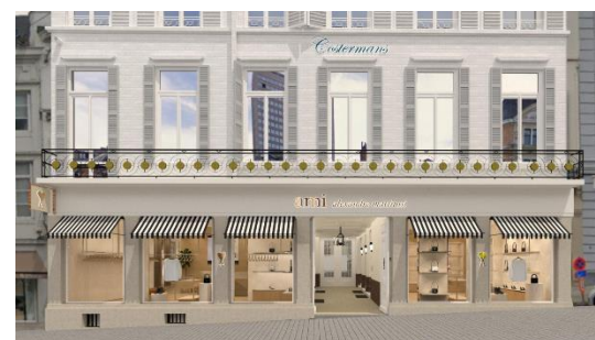
Élévation de la situation projetée. Document extrait du dossier de demande.