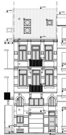
Élévation projetée de la façade. Image tirée du dossier de demande.

La demande porte sur la mise en conformité de la division et des travaux de transformation de la maison en un logement communautaire (8 chambres et parties communes). En ce qui concerne les châssis, la CRMS désapprouve le remplacement, en 2020, des menuiseries en bois peintes en vert (encore d'origine ?) par des châssis en PVC blanc de qualité médiocre. En outre, d'autres interventions ont altéré la façade avant, notamment la création d'une porte de garage, la mise en peinture anthracite de la façade, etc. Ces transformations ont-elles fait l'objet d'une autorisation préalable ? La situation de droit du bien devrait être clarifiée.