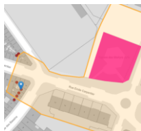
Situation patrimoniale

En réponse à votre courrier du 23/09/2025, nous vous communiquons l'avis émis par la CRMS en sa séance du 15/10/2025, concernant la demande sous rubrique.