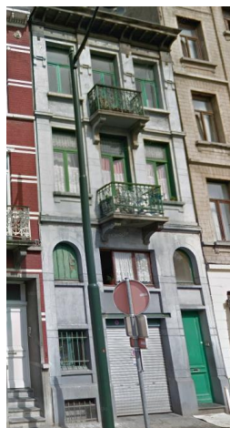
Façade à rue en 2019