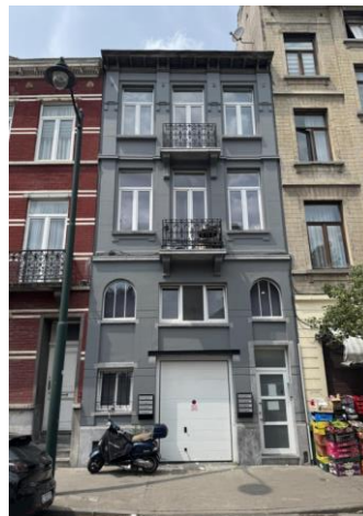
Façade à rue actuelle