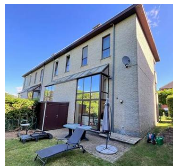
Situation de fait en façade arrière. Image tirée du dossier

Le projet n'aura pas d'impact sur les vues vers et depuis le site classé du Kattebroek et n'appelle pas de remarques d'ordre patrimonial.