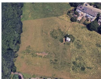
Vue aérienne du bien et du site du Kattebroek