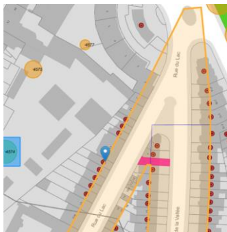
Situation patrimoniale

En réponse à votre courrier du 23/09/2025, nous vous communiquons l'avis émis par la CRMS en sa séance du 15/10/2025, concernant la demande sous rubrique.