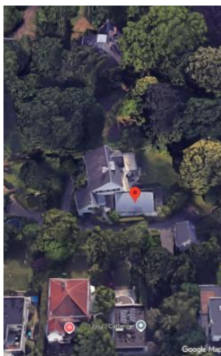
Vue aérienne de la maison. Le Manoir Pirene est visible en arrière fond.