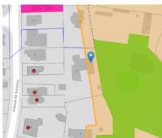
Situation patrimoniale

En réponse à votre courrier du 08/10/2025, nous vous communiquons l'avis émis par la CRMS en sa séance du 15/10/2025, concernant la demande sous rubrique.