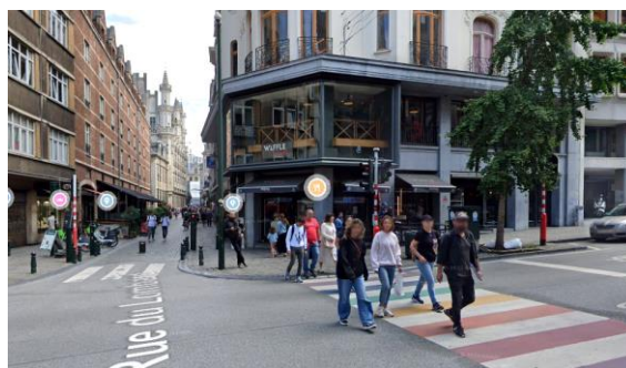
Situation existante