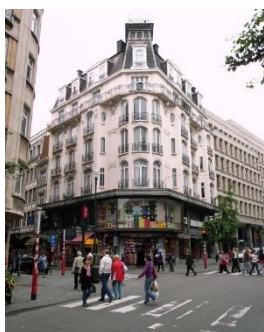
Façade de l'immeuble classé, photographié en 2018.