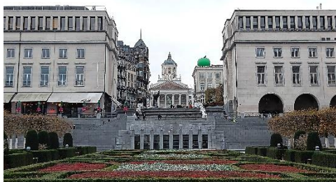
Zone sud du Mont des Arts avant et après la pose de tentes solaires devant les arcades

La présence des tentes rétractables actuelles et leur prolongement sur le retour le long de l'escalier monumental, altèrent la lisibilité des arcades, composantes structurantes de cette séquence architecturale. Le déploiement des tentes rompt également avec la symétrie des pavillons qui cadrent l'escalier monumental ainsi que les perspectives vers la place Royale et vers le bas de la ville.