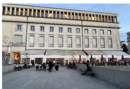
Localisation patrimoniale (© Brugis), aile 'Congres' en 1985 et occupation pendant l'hiver 2024 (photos extraites de la demande)

Le dossier concerne les espaces situés au rez-de-chaussée de l'ancien Palais des Congrès de Bruxelles, occupant la partie sud du Mont des Arts. Cet ensemble monumental a été réalisé entre 1954 et 1958 d'après les plans des architectes Maurice Hoyoux et Jules Ghobert, auteur du Palais du Congrès, en collaboration avec l'architecte-paysagiste René Pechère.