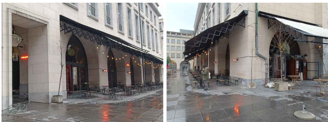
Situation existante

Cette demande de permis unique fait suite à plusieurs procès-verbaux d'infractions dressés par Urban-ISA en 2022 et 2024 1 . Elle vise :