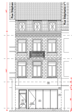
Façade avant. Situation existante.

Dans un objectif d'améliorer le contexte urbain de l'ancienne maison communale de Laeken dans lequel s'inscrit la maison, la CRMS demande d'améliorer le projet selon les remarques suivantes :