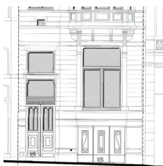
Façade avant. Situation de droit (1950)