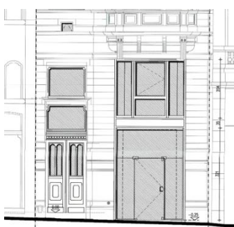
Façade avant. Situation de fait.