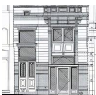
Façade avant. Projet demandé en juillet 2022