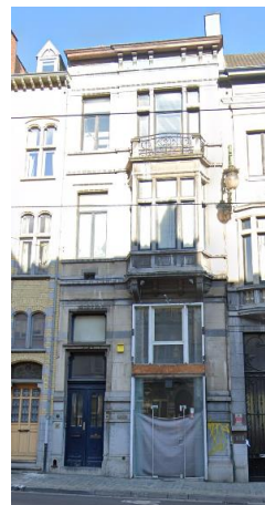
Vue de l'immeuble en 2024