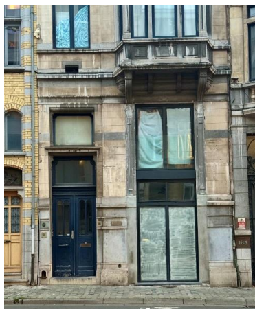
Zoom sur la nouvelle composition. Photo CRMS décembre 2025.

La nouvelle composition n'adopte plus un langage historicisant et s'inscrit désormais dans une expression contemporaine, répondant ainsi au dernier avis de la CRMS. Elle gagnerait toutefois en qualité et aurait une meilleure intégration au bâtiment existant si la teinte du châssis contemporain était identique à celle des autres menuiseries de la maison (bleu foncé), si les profils moulurés du soubassement se prolongeaient dans la nouvelle pierre bleue et si les lignes du nouveau châssis établissaient un meilleur dialogue avec celles de la façade (bandeaux, etc.).