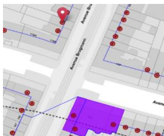
Situation patrimoniale

Le bien est repris dans la zone de protection d'un ensemble de 3 maisons Art-Nouveau sises Avenue Molière 177 (classées par AG du 28/06/2001). Il est aussi inscrit à l'inventaire du patrimoine architectural.