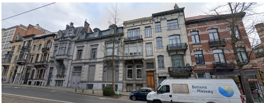
Vue de l'ensemble homogène formé par les immeubles n° 175 à 187.

Le bien est une maison bourgeoise de style éclectique conçue par l'architecte Alexandre Desruelles en 1906. Elle fait partie d'une rangée homogène de maisons, du n° 175 au n° 187. Outre son intérêt architectural, cette maison s'inscrit dans un ensemble de bâtiments de qualité (style, type, matériaux et du même auteur), qui possède, par sa cohérence et son homogénéité, une valeur urbanistique. Depuis 1994, la baie principale du rez-de-chaussée est dénaturée par l'installation d'une vitrine de magasin.