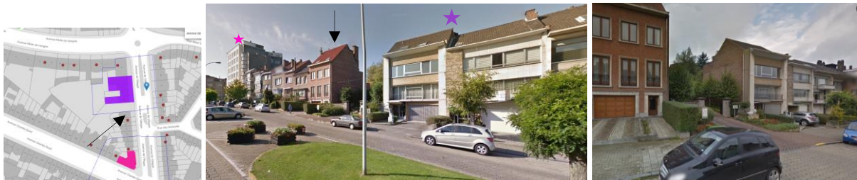
Localisation du projet et enfilade concernée par le projet

La demande porte sur l'isolation thermique de la maison située au 19, avenue de Villegas à Ganshoren, dont le pignon de droite est compris dans la zone de protection de l'ensemble formé par les trois maisons classées des n os 25 à 31 (architectes R. Brunswyck et O. Wathelet, 1965).