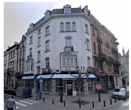
Façades à rue. Photomontage 3D de la situation projetée. Image tirée du dossier de demande

La multiplication des tentes solaires a un impact sur les perspectives vers et depuis les biens classés. La CRMS demande de réduire ce dispositif au strict nécessaire et d'appliquer de manière stricte les prescriptions du RRU en la matière. À ce sujet, la nouvelle tente solaire sous le bow-window semble peu pertinente sur le plan fonctionnel (cuisine à l'arrière).