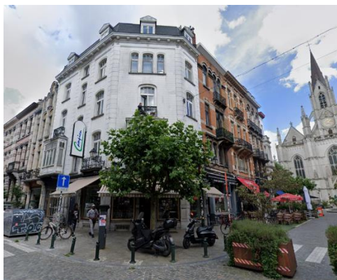
Façades à rue. Situation existante.