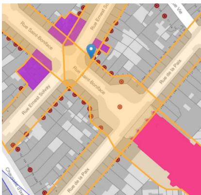
Situation patrimoniale

En réponse à votre courrier du 11/12/2025, nous vous communiquons l'avis émis par la CRMS en sa séance du 17/12/2025, concernant la demande sous rubrique.