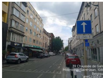
Vers la chaussée de Gand et des câbles en place (image extraite du dossier)