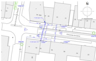
Schéma d'implantation des câbles à la Chaussée de Gand (image extraite du dossier)

En réponse à votre courrier du 04/12/2025, nous vous communiquons l'avis émis par la CRMS en sa séance du 17/12/2025, concernant la demande sous rubrique.