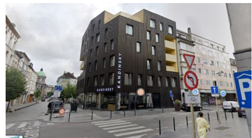
Vue de l'angle à la chaussée de Gand et de l'Hôtel communal classé

Les installations n'ont pas d'impact sur les perspectives vers et depuis la maison communale de Molenbeek ni vers l'ancien dépôt de la manufacture de tabac AJJA. De manière générale, la CRMS demande de veiller à une pose soignée de ce type de câblage et des dispositifs qui y sont liés (localisation des câbles à des endroits peu visibles, teinte des boîtiers...). Elle s'interroge par ailleurs sur la présence de câbles traversant la voirie à certains endroits (notamment à hauteur de la chaussée de Gand n°s 37 et 33), ce qui ne contribue pas à la qualité du paysage urbain.