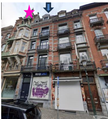
Vue de l'immeuble (flèche bleue). En rose, l'immeuble voisin classé.

En réponse à votre courrier du 20/11/2025, reçu le 24/11/2025, nous vous communiquons l'avis émis par la CRMS en sa séance du 17/12/2025, concernant la demande sous rubrique.