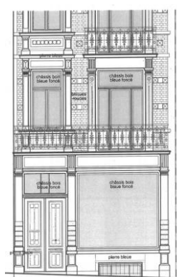
Façade à rue. Situation de fait