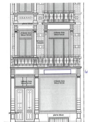
Façade à rue. Situation projetée