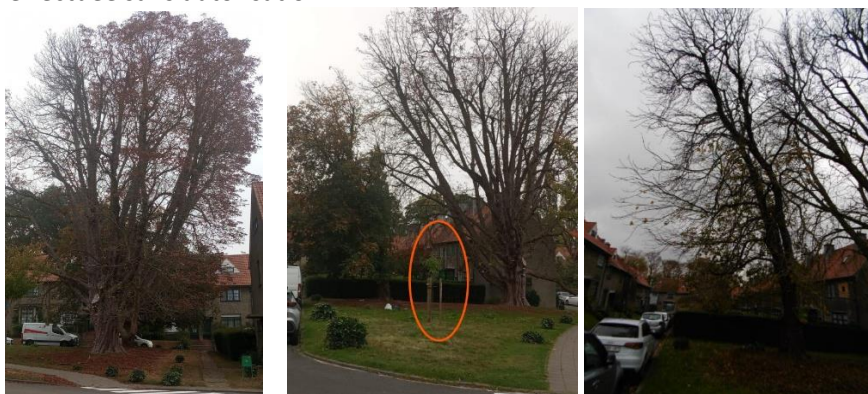
A gauche, le marronnier d'Inde (3903), au centre le châtaignier planté en 2024, à droite le marronnier rouge penchant vers la rue des Ibis (extraits du dossier)

Il s'agit de l'abattage des deux marronniers restants sur la parcelle, dont le marronnier 3903 inscrit à l'inventaire, et de leur remplacement par deux châtaigniers. Il n'est pas fait mention de la replantation du châtaignier effectuée sans autorisation.