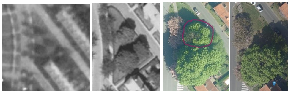
Orthophotoplans 1944, 1953, 2016 et 2017

Trois marronniers existent à cet endroit de la parcelle depuis l'origine du Logis, comme en attestent les photos aériennes depuis 1944. Les photos de 2016 et 2017 indiquent le marronnier dépérissant et sa souche après abattage.