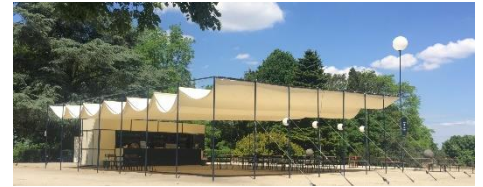
Vue de la guinguette installée. Montag3D. Image extraite du dossier.