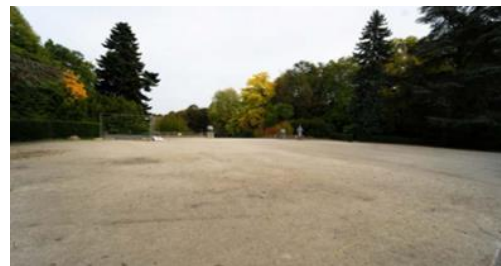
Vue de la localisation de la guinguette.

L'arrêté royal du 26 octobre 1973 classe comme site l'ensemble du parc Duden à Forest.