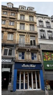
État existant, photo extraite de la demande.