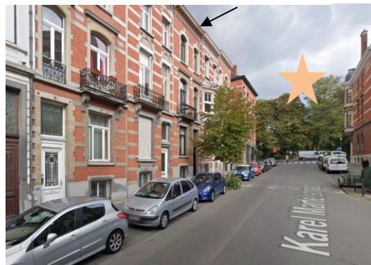
Localisation du bien