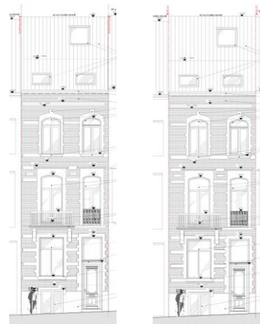
Plans d'élevation des façades existante et projetée, extraits de la demande

Datant de 1893, la maison appartient à un bel ensemble de maisons de style éclectique conçu par l'architecte Émile Janlet, qui participe à la qualité du paysage urbain des squares du Quartier Nord-Est, classés comme site. La CRMS ne peut souscrire à la régularisation des châssis en PVC du n°56, qui ne met pas la façade en valeur. Elle demande que ceux-ci soient remplacés par des châssis qualitatifs en bois, de type traditionnel et de ton clair, en cohérence avec ceux des maisons mitoyennes situées aux numéros 52 à 58. Dans un même souci de cohérence patrimoniale de cette enfilade de maisons, la CRMS encourage, pour le balcon du premier étage, la restitution d'un garde-corps s'inspirant de ceux d'origine encore conservés en façades des maisons voisines.