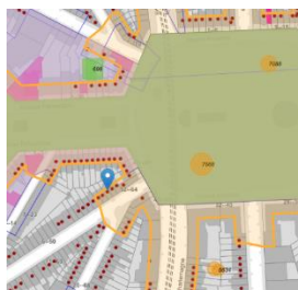
Localisation du bien

En réponse à votre courrier du 10/03/2026, nous vous communiquons l'avis émis par la CRMS en sa séance du 18/03/2026, concernant la demande sous rubrique.