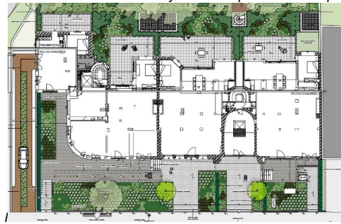
Implantation de la zone de recul. Nouvelle proposition