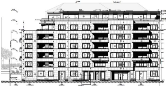
Élévation à rue. Permis d'urbanisme délivré (situation de droit)