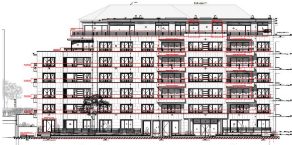
Élévation projetée à rue. Nouvelle proposition