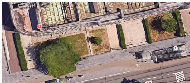
Situation patrimoniale Photo du bâtiment existant.