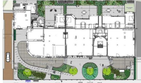
Implantation de la zone de recul. Projet vu en septembre 2025 par la CRMS