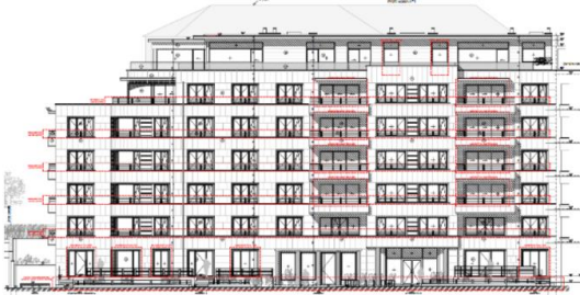
Élévation projetée à rue. Projet vu en septembre 2025 par la CRMS