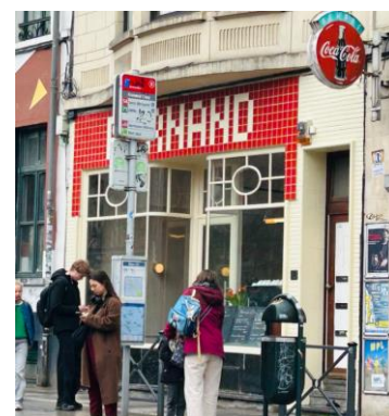
Façade à rue. Situation existante Mars 2026

Le projet (déjà réalisé) ne porte pas atteinte aux perspectives vers et depuis le bien classé. Il maintient la devanture historique et en préserve les caractéristiques patrimoniales. Bien que sa teinte rouge soit très affirmée, la nouvelle enseigne présente une mise en œuvre soignée. La mise en peinture crème des châssis et de la devanture constitue par ailleurs une amélioration.