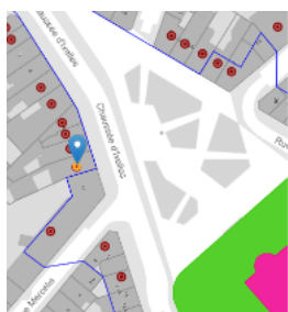
Situation patrimoniale

En réponse à votre courrier du 26/02/2026, nous vous communiquons l'avis émis par la CRMS en sa séance du 18/03/2026, concernant la demande sous rubrique.