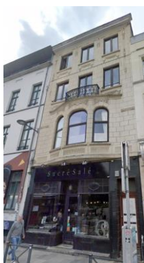
Façade à rue. Situation avant travaux