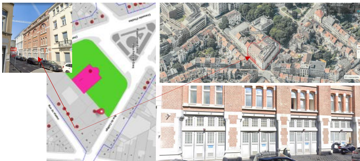
Localisation et vues actuelles

En réponse à votre courrier du 09/03/2026, nous vous communiquons l'avis émis par la CRMS en sa séance du 18/03/2026, concernant la demande sous rubrique.