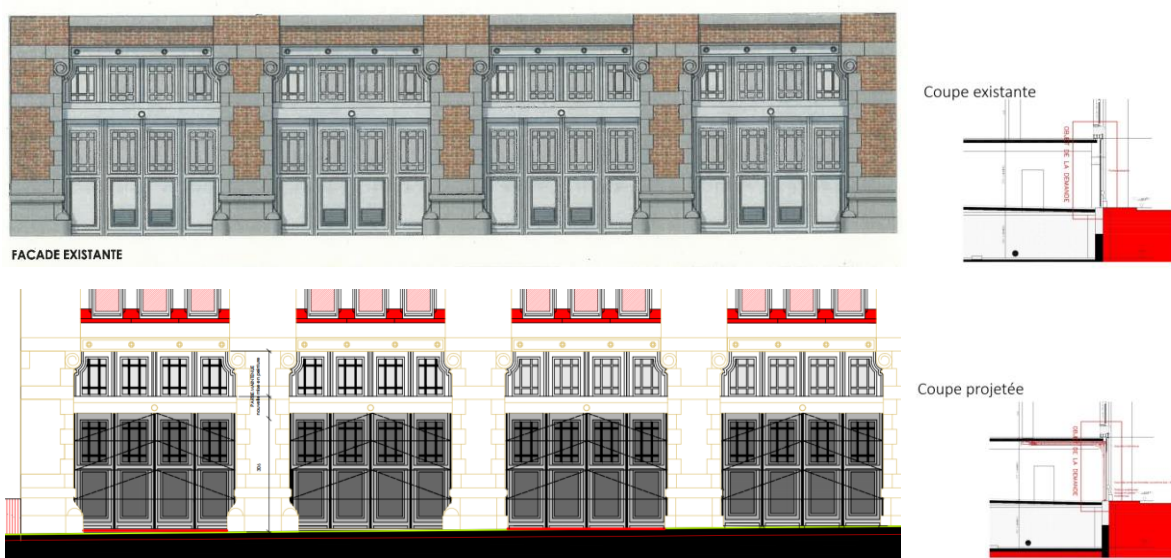
Élevations et coupes existantes et projetées (extraits du dossier)

Aujourd'hui, une demande modificative est introduite pour remplacer les portes actuelles par de nouvelles portes sectionnelles en bois, en retrait de 6 à 10 cm. Celles-ci reprendront la composition existante (quatre pans verticaux, proportions d'origine, cadres moulurés et croisillons, etc.). Pour des raisons de sécurité, les vitrages seront remplacés par des panneaux de bois sur lesquels seront fixés les croisillons. Les grilles dans le bas des portes seront supprimées.