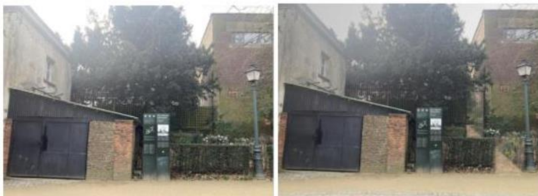
Vue du parc vers l'arrière du bâtiment Bd de Waterloo 34à34B et montage photo.