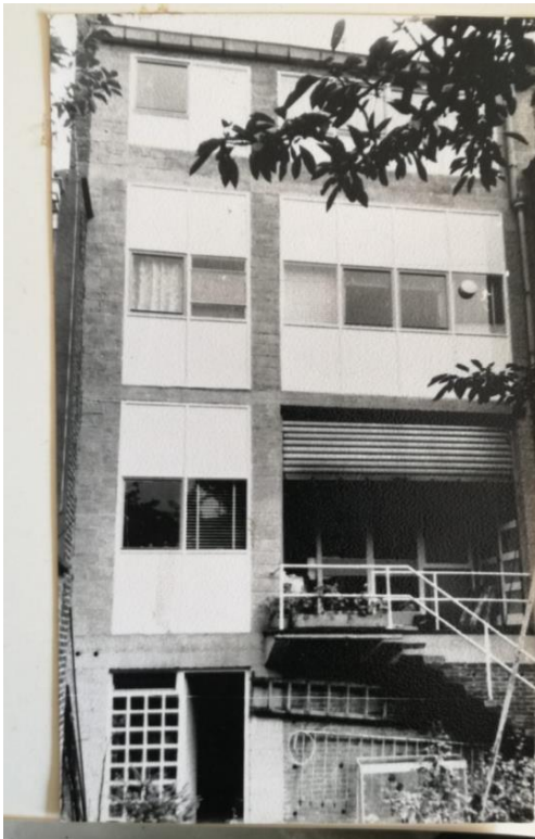
afbeelding 8- foto tuingevel, begin jaren 1970 - Referentiesituatie

In de vergunningsaanvraag worden de werken nauwkeurig beschreven en het nieuwe schrijnwerk gedetailleerd. Als antwoord op het principeadvies van de KCML stelt men bovendien voor om de bovenpanelen van het raamgeheel in de linker travee van de bel-étage en van de ramen op de tweede verdieping in te vullen met een translucide beglazing in plaats van met helder glas, zoals in het voorontwerp werd voorgesteld. Op die manier wordt de alternatie tussen open en gesloten delen en de eruit voortvloeiende sterke horizontale geleiding van de oorspronkelijke achtergevel opnieuw meer leesbaar. De uiteindelijke keuze van de beglazing zal gebeuren op basis van een mock-up ter plaatse. De KCML onderschrijft dit voorstel en vraagt aan de DPC om dit verder op te volgen.