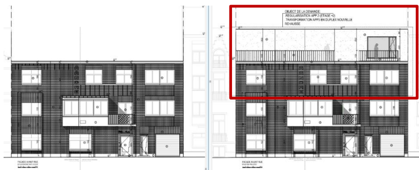
Situations existante et projetée avec la surhausse (extraits du dossier)

le transformer en duplex en ajoutant un étage supplémentaire sur la toiture plate actuelle (avec ajout de deux terrasses accessibles en façade avant). La surhausse serait réalisée avec une structure en bois et la finition de la façade serait en crépi blanc. Les garde-corps qualifiés de « modernes et sécurisés » seraient en aluminium anthracite.