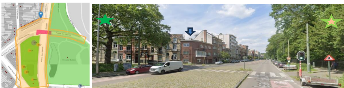
Localisation (@ Brugis) et vue de l'immeuble dans l'avenue Sobieski (@ Google maps)

En réponse à votre courrier du 08/04/2026, nous vous communiquons l'avis défavorable émis par la CRMS en sa séance du 22/04/2026, concernant la demande sous rubrique.