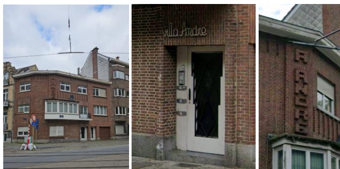
Façade et détails Art Déco (@ Google maps)

Bien que la demande se limite à des travaux concernant l'appartement du deuxième étage, la Commission estime que l'immeuble présente un intérêt architectural dans son ensemble et qu'il mérite, à ce titre, une attention qualitative particulière. Or, le dossier apparaît relativement sommaire et peu satisfaisant.