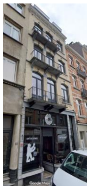
Photo de l'immeuble.