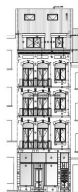
Élévation avant. Situation de fait. Extrait du dossier.

L'installation de lucarnes en versant de toiture avant et arrière a été autorisée par un permis d'urbanisme délivré en 2004, qui établit la situation de droit. La CRMS ne s'était pas prononcée sur ce permis— l'ancienne boucherie sise au n°108 de la rue n'étant alors pas encore classée. La demande porte sur la régularisation des lucarnes existantes, qui ont été réalisées différemment de celles prévues dans le permis délivré, ainsi que sur divers travaux intérieurs et en façade arrière.