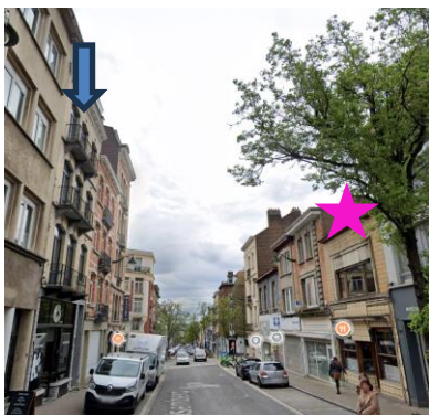
Vue de l'immeuble (flèche bleue) et de la boucherie classée (rose).

En réponse à votre courrier du 01/04/2026, nous vous communiquons l'avis émis par la CRMS en sa séance du 22/04/2026, concernant la demande sous rubrique.