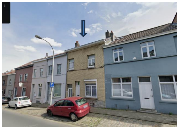
Vue avec localisation du bien