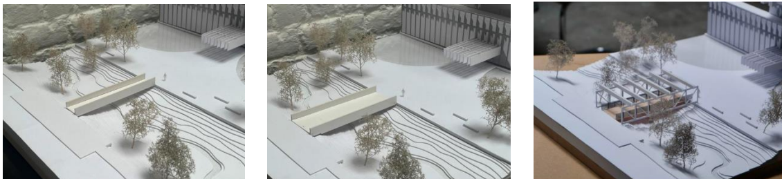
Les 3 variantes de la passerelle – rsp. de 3m, de 5m et de 6 à 9m. – extr. des documents fournis

La Commission opte pour la deuxième variante, à savoir une passerelle d'une largeur de 5m permettant de répondre à l'échelle de l'immeuble auquel elle fait face, tout en restant discrète et en retrait par rapport au monument (ce qui ne serait pas le cas de la 3 e variante dont le développement est nettement plus imposant). Elle demande de poursuivre l'étude sur sa conception et sa matérialité de manière à inscrire l'ouvrage subtilement dans le site (par exemple, en s'inspirant de la matérialité de la nouvelle terrasse construite sur l'étang sud).