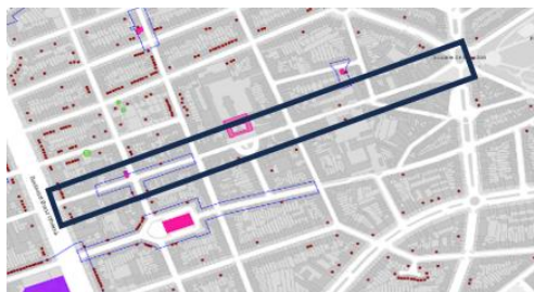
Situation patrimoniale

En réponse à votre courrier du 03/04/2026, nous vous communiquons l'avis émis par la CRMS en sa séance du 22/04/2026, concernant la demande sous rubrique.