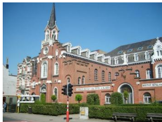
L'Institut Royal pour Sourds, Muets et Aveugles.