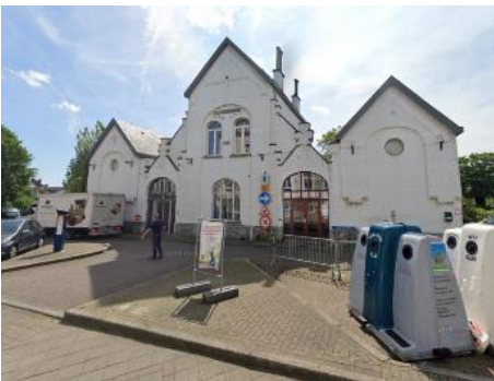
L'ancienne Métairie Van Meyel.

La Commission estime cependant qu'une attention plus importante pourrait être portée à la mise en valeur des abords immédiats de l'ancienne Métairie Van Meyel. Elle encourage la Commune à entreprendre une requalification globale de cet espace qui comprend également deux arbres remarquables repris à l'inventaire. Dans ce cadre, elle plaide pour une révision de la zone de stationnement (éviter la rangée continue d'emplacements de parking en épi devant le bâtiment), une valorisation de l'espace situé à l'arrière et un renforcement global de la végétalisation 3 .