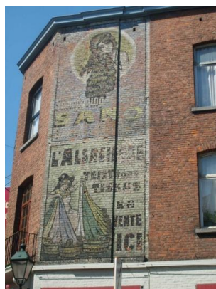
L'immeuble avec les Peintures publicitaires murales « Sano » et « L'Alsacienne ».