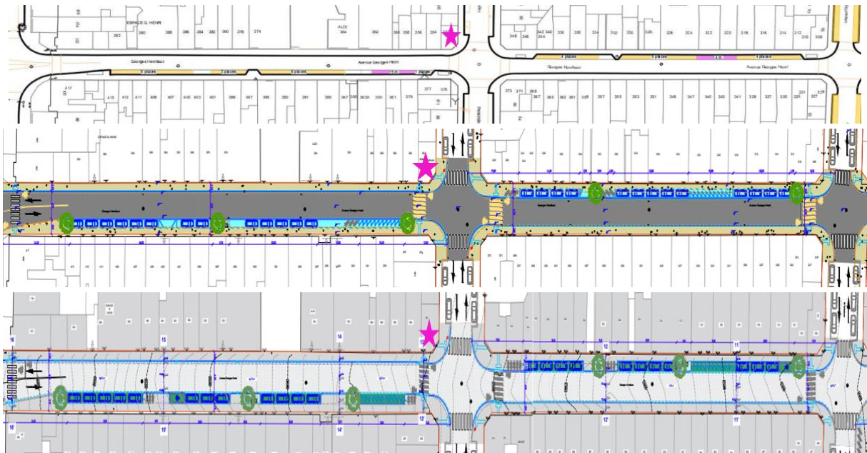
L'avenue entre le boulevard Brand Whitlock et le carrefour avec l'avenue du Prince Héritier avec la localisation des peintures murales classées. Situation existante, situation projetée vue par la CRMS lors de la réunion de projet du 24/09/2025 et situation projetée de la présente demande. Images extraites du dossier, avec ajout de la CRMS.

Le projet prévoit un réaménagement complet de l'espace public du tronçon de l'avenue Georges Henri compris entre le boulevard Brand Whitlock et le square Meudon. La voirie est reconfigurée afin d'améliorer la circulation des bus, les trottoirs sont élargis et rendus continus, et les traversées piétonnes mises aux normes. La végétalisation est renforcée, le nombre d'arbres passant de 8 à 39. Le projet intègre également une désimperméabilisation de certaines zones, notamment par la création de fosses de plantation et l'aménagement de zones de stationnement en revêtements semi-perméables. Enfin, la place Jean-Baptiste Degroff, située devant l'Institut royal pour Sourds, Muets et Aveugles, fait l'objet d'un réaménagement avec la création d'une zone de rencontre de plain-pied, accompagnée d'une déminéralisation et d'un renforcement de la végétalisation.