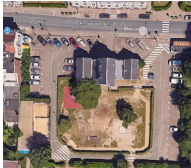
Vue aérienne de l'ancienne métairie et ses abords.