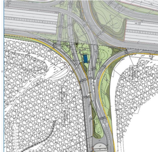
Situation existante et plan de démolition. Image extraite du dossier de demande Situation projetée. Image extraite du dossier de demande

Les travaux prévoient l'enlèvement de la voirie et du sol afin de mettre à nu la dalle au-dessus des tunnels. La dalle sera équipée d'un dispositif d'étanchéité et de conduites de drainage reliées au système d'égouttage. Les fondations et les revêtements de voiries sont entièrement refaits. Le tracé des voiries est légèrement modifié par rapport à la situation actuelle et les bandes de circulation sont réduites le long de l'axe E411. Cette réduction implique une augmentation de la désimperméabilisation de la zone. (L'emprise de désimperméabilisation est de 680 m 2 ). Les équipements de sécurité sont remplacés et modernisés. Les bermes séparatrices entre les bandes de circulation ainsi que les glissières de sécurité le long des bermes sont conservées.