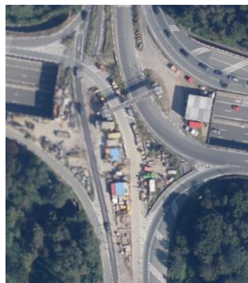
Orthophotoplan du carrefour Léonard.

L'arrêté royal du 2/12/1959 classe comme site l'ensemble formé par la Forêt de Soignes et le Bois des Capucins sur les territoires des communes d'Auderghem, Duisbourg, Hoeilaart, La Hulpe, Rhode-Saint Genèse, Tervuren, Uccle, Waterloo, Watermael-Boitsfort et Woluwe-Saint-Pierre.