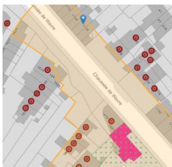
Localisation du bien

En réponse à votre courrier du 28/04/2026, nous vous communiquons l'avis émis par la CRMS en sa séance du 13/05/2026, concernant la demande sous rubrique.