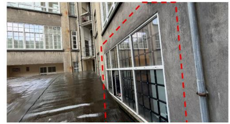
Châssis existants (objet de la demande de régularisation) – extr. du dossier de demande

En ce qui concerne la fermeture de la terrasse arrière, la CRMS ne souscrit pas à la régularisation du châssis existant qui présente un aspect peu qualitatif et des divisions peu appropriées, et qui ne participe pas à la valorisation des façades arrière.