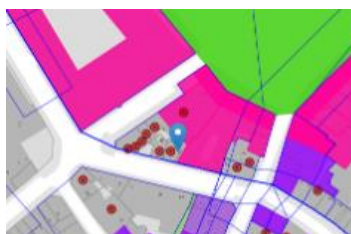
Localisation du bien

En réponse à votre courrier du 04/05/2026, nous vous communiquons l'avis émis par la CRMS en sa séance du 13/05/2026, concernant la demande sous rubrique.