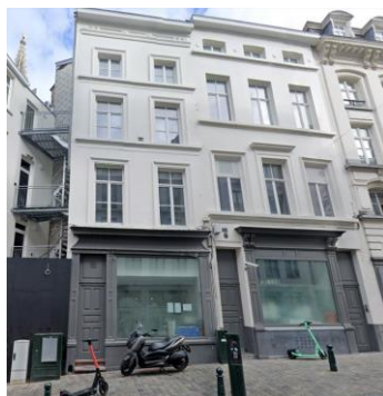
Photo et plan d'élévation de la façade existante et projetée, extraits de la demande