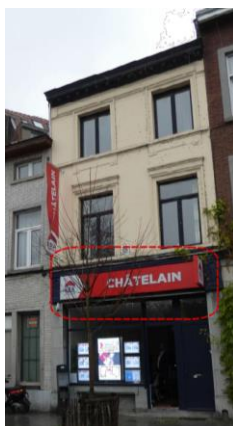
Photo de l'immeuble. Extrait du dossier.