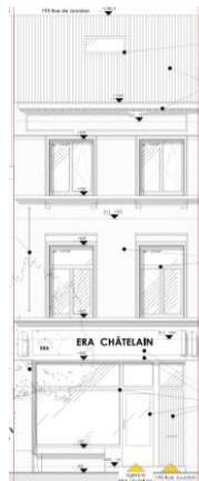
Façade à rue. Situation de fait. Extrait du dossier.