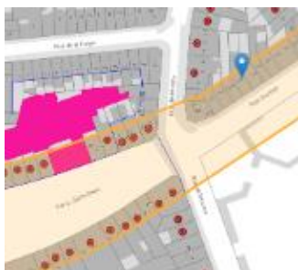
Situation patrimoniale

En réponse à votre courrier du 04/05/2026, nous vous communiquons l'avis émis par la CRMS en sa séance du 22/05/2026, concernant la demande sous rubrique.