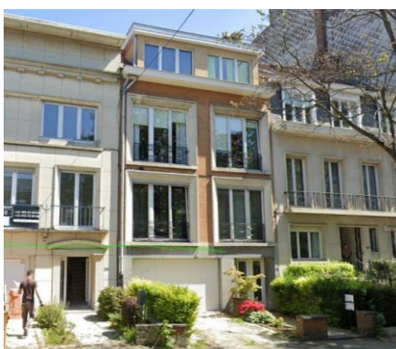
Photo de la façade sur rue, extraite de la demande