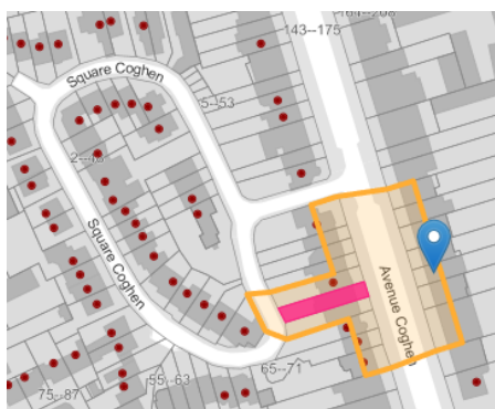
Localisation du bien

En réponse à votre courrier du 06/05/2026, nous vous communiquons l'avis émis par la CRMS en sa séance du 03/06/2026, concernant la demande sous rubrique.