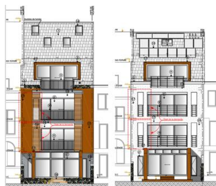
Plans d'élévation des états de droit et de fait de la façade arrière, extraits de la demande

Les actes et travaux qui font l'objet de la demande sont concentrés en façade arrière de l'immeuble. Ils n'ont pas d'impact sur les vues vers et depuis le bien classé situé à proximité et n'appellent pas de remarques d'ordre patrimonial.