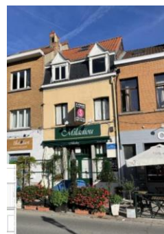
État du bien vers 2023

Les travaux prévus en toiture et en façade avant se justifient sur le plan architectural. En ce qui concerne le traitement de la façade, la CRMS recommande toutefois de maintenir une teinte blanche conformément à la situation de droit, et d'y associer des châssis également de ton blanc, plus cohérents sur le plan architectural que les teintes proposées (enduit ocre, châssis en bois naturel).