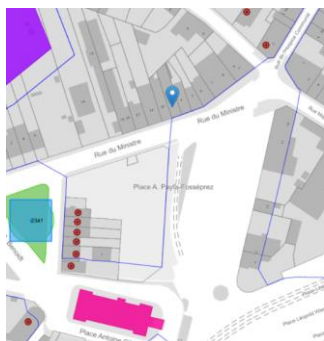
Localisation du bien

En réponse à votre courrier du 22/04/2026, nous vous communiquons l'avis émis par la CRMS en sa séance du 13/05/2026, concernant la demande sous rubrique.