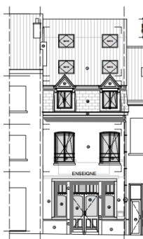
Plans d'élévation de la situation de droit et projetée, extraits de la demande