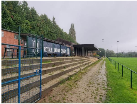
Vue des gradins à gauche des tribunes