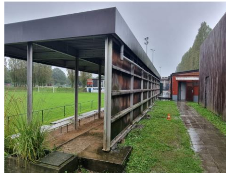
Vue des tribunes métalliques