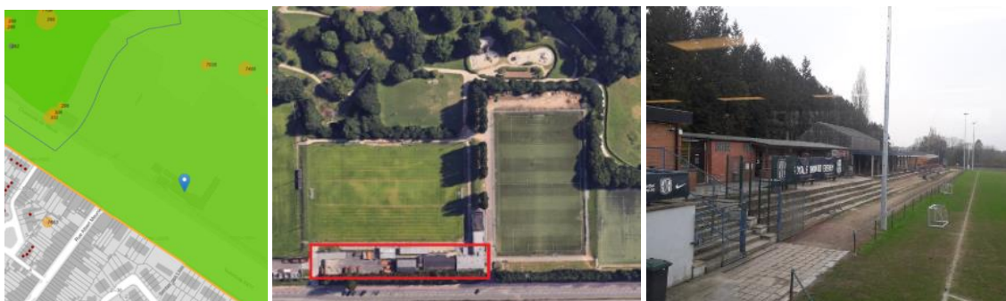
Localisation (© Brugis), vue aérienne et des gradins (extraits du dossier)

En réponse à votre courrier du 12/02/2026, nous vous communiquons l'avis conforme favorable émis par notre Assemblée en sa séance du 03/06/2026, concernant la demande sous rubrique.