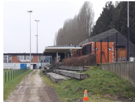
Vue des gradins à droite des tribunes