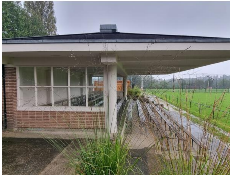
Vue des tribunes couvertes en béton